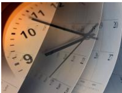
SCADENZE FISCALI DAL 1° AL 20 AGOSTO DIFFERITE DALLA LEGGE N.44/12

INVIO NOTIFICHE INTERROTTO TRA IL 25 LUGLIO E IL 31 AGOSTO