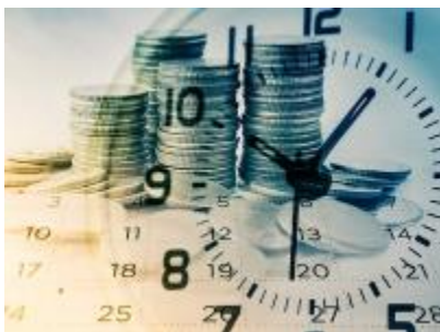
SCADENZE PREVIDENZIALI DAL 1° AL 20 AGOSTO DIFFERITE

CONTROLLI AUTOMATIZZATI INTERROTTI TRA L'ULTIMA SETTIMANA DI LUGLIO E LA PRIMA DI SETTEMBRE