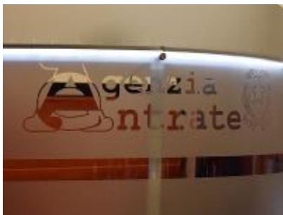
CONTROLLI FISCALI, TREGUA ESTIVA

DIFFERIMENTO CONCESSO FINO AL 20 AGOSTO SENZA ALCUNA MAGGIORAZIONE