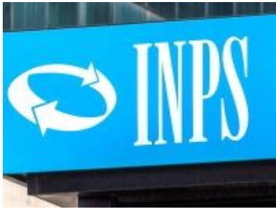
TREGUA ESTIVA NOTIFICHE INPS

L'Inps sospenderà le note di rettifica, le diffide di adempimento, le elaborazioni delle richieste "DurcOnLine" e anche la trasmissione dei crediti all'Agente della riscossione.